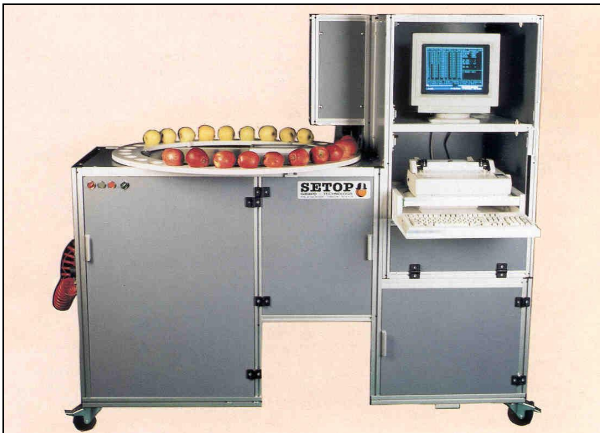
Abb. 1: Analysenlabor „Pimprenelle“

Die Messung der Fruchtfleischfestigkeit erfolgt mit Hilfe eines Penetrometers. Dies kann ein einfacher Handpenetrometer (z.B. Effe-gi) oder ein technisch aufwendiges Gerät mit konstantem Anpreßdruck (z.B. Instron) sein. Auch das vollautomatische Qualitäts- und Reifenanalysengerät „Pimprenelle“ aus Frankreich ermittelt neben dem Einzelfruchtgewicht, dem Refraktometer- und Säurewert auch exakt die Fruchtfleischfestigkeit.